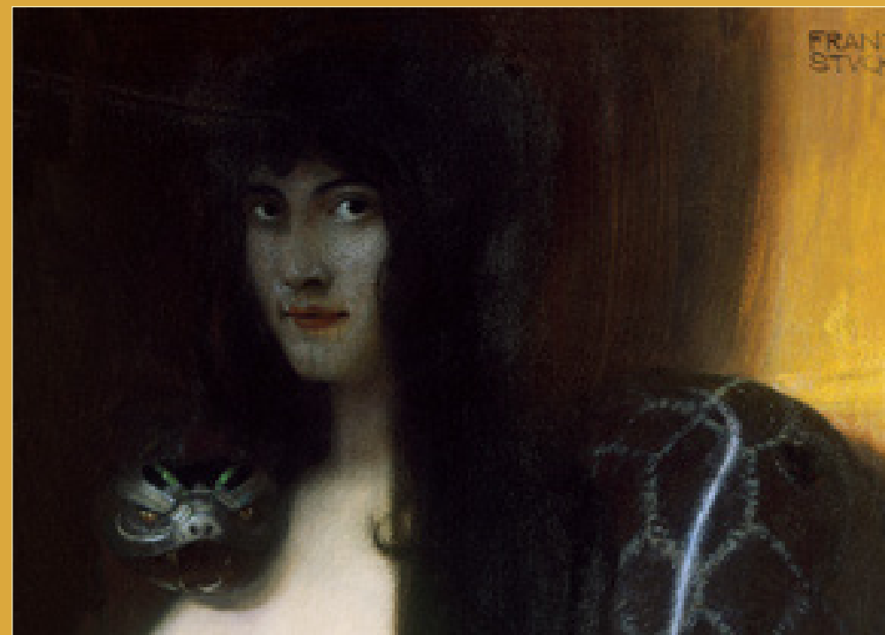
Franz von Stuck, Le péché (1893)