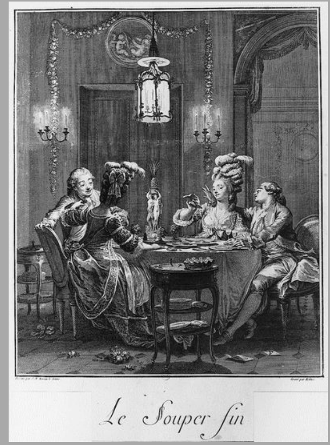
Moreau le Jeune, Le Souper fin