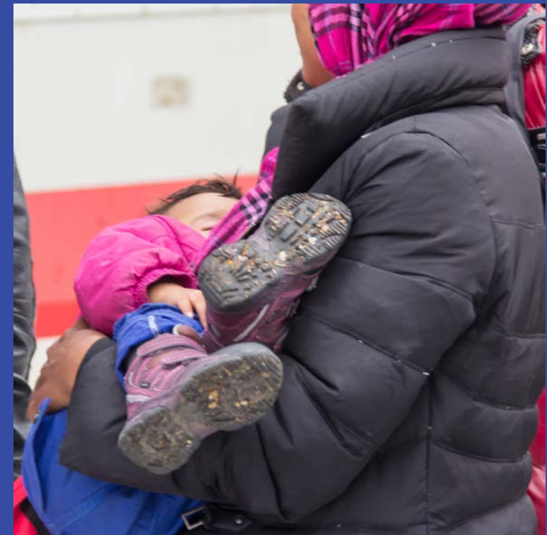
Des réfugiés qui arrivent de la frontière germano-autrichienne à bord d'un train spécial de la Deutsche Bahn à la gare de l'aéroport de Cologne-Bonn. 5 octobre 2015