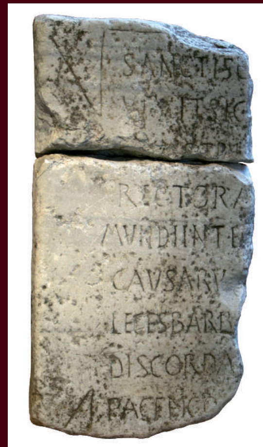
fragments de la stèle de Sidoine Apollinaire conservés au Musée Bargoin