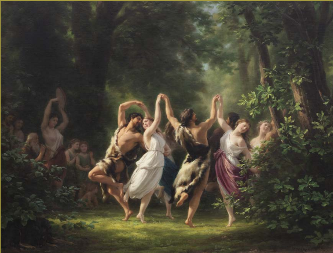
Fritz Zuber-Bühler, La danse des Sylvains