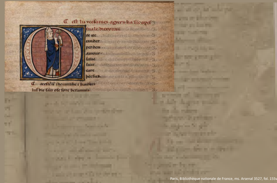
Paris, Bibliothèque nationale de France, ms. Arsenal 3527, fol. 155v

Grégoire ou le bon pêcheur en contexte européen Textes, circulation et réécritures (XII e - XVII e siècles)