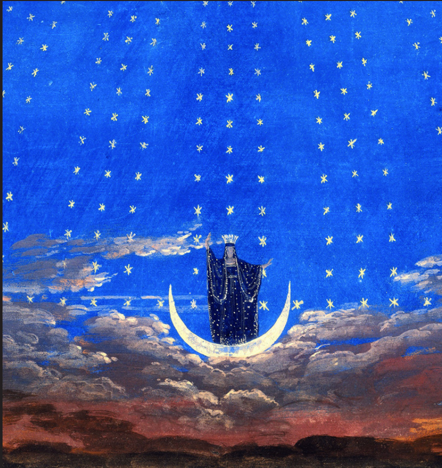
La apparition de la Reine de la Nuit. Décor de Karl Friedrich Schinkel pour La Fille enchantée de Mozart, 1816