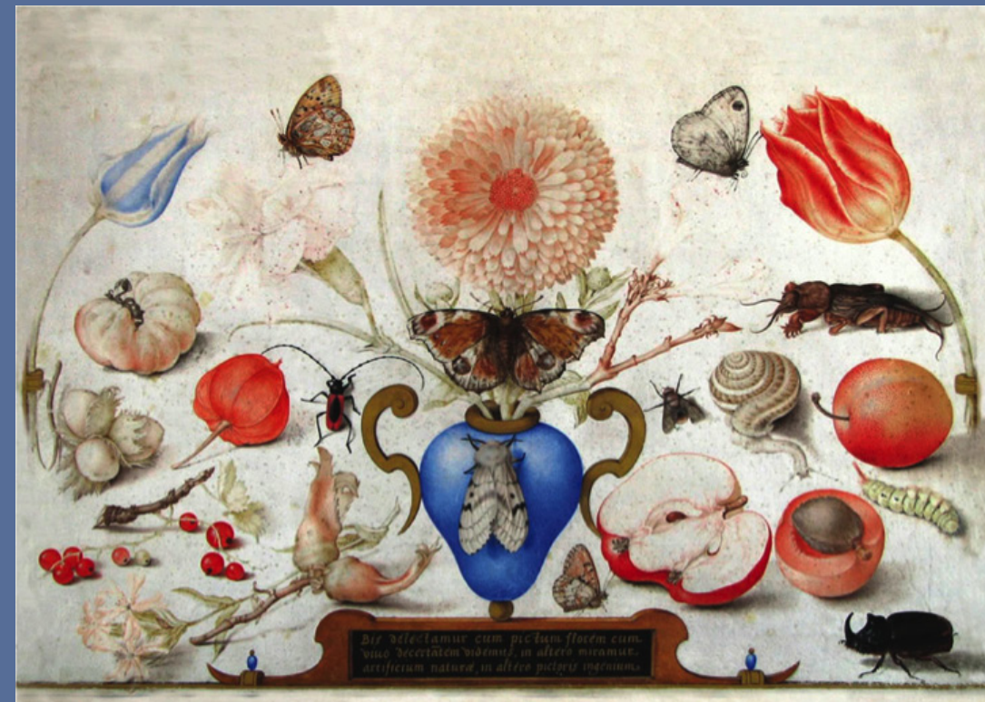
Insectes de Joris Hoefnagel (env. 1570)