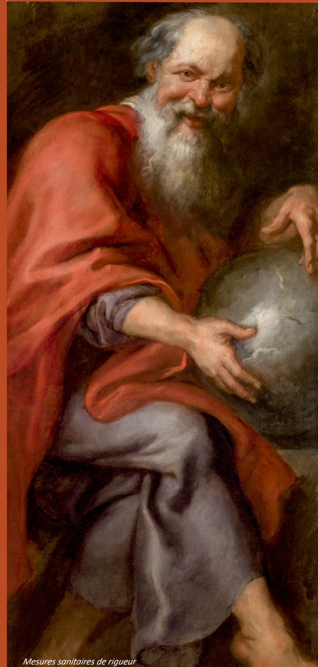
Mesures sanitaires de rigueur

Etude des rapports entre satire et philosophie dans les textes littéraires et philosophiques de l'Antiquité jusqu'au XVIII e siècle