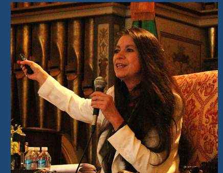
Carmen BOULLOSA (México)

Premio Reina Sofía de Poesía Iberoamericana, 2021