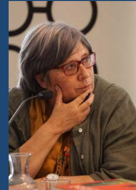
Ana Luisa AMARAL (Portugal)

Prix Reina Sofia de Poesía Iberoamericana, 2021