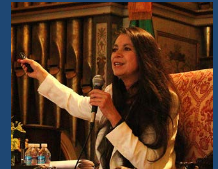
Carmen BOULLOSA (Mexique)

Prix Reina Sofia de Poesía Iberoamericana, 2021