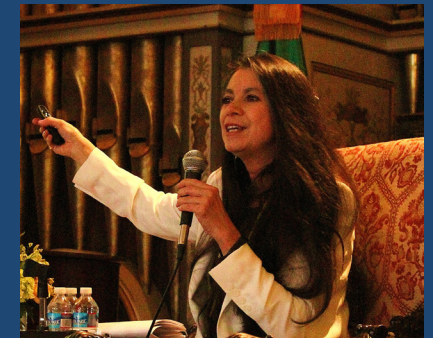
Carmen BOULLOSA (México)

Prémio Reina Sofía de Poesía Iberoamericana, 2021