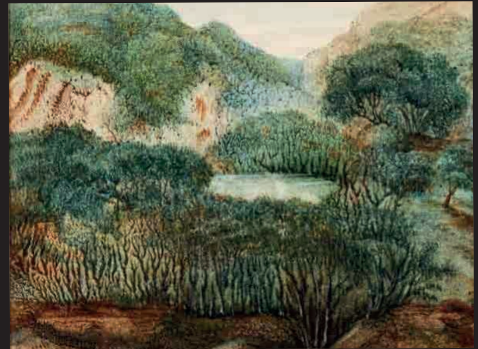
George Sand, dendrite. Musée de la vie romantique. Paris.