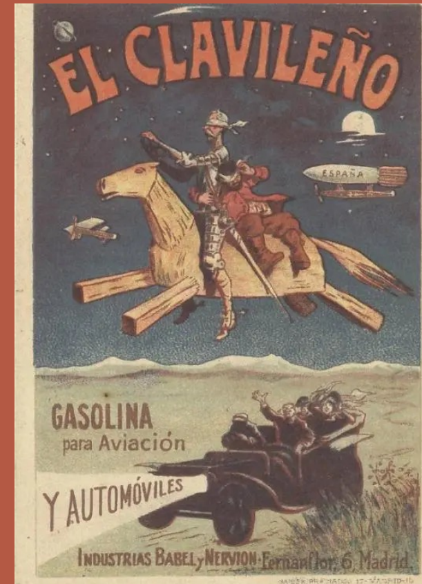
Publicité de la marque d'essence El Clavileño (1907)