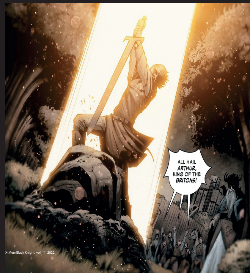
X-Men/Black Knight, vol. 11, 2022.