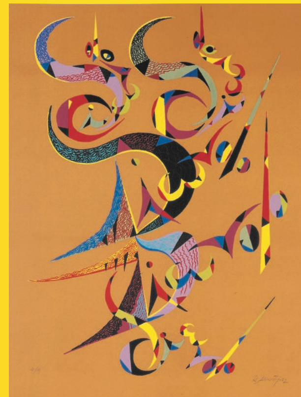
Rafael Alberti, "D", Lircogramas (1972)