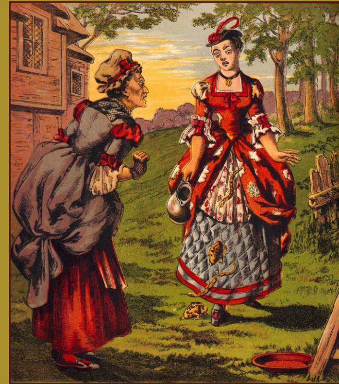
«Diamonds and toads» (Diamants et crapauds) illustrée par Laura Valentine en 1870.